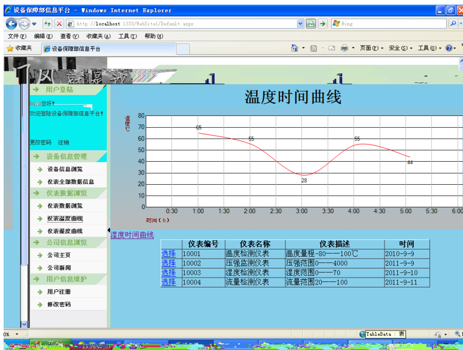
远程浏览运行信息界面