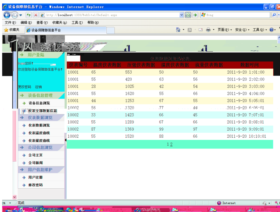
远程查看设备历史数据界面